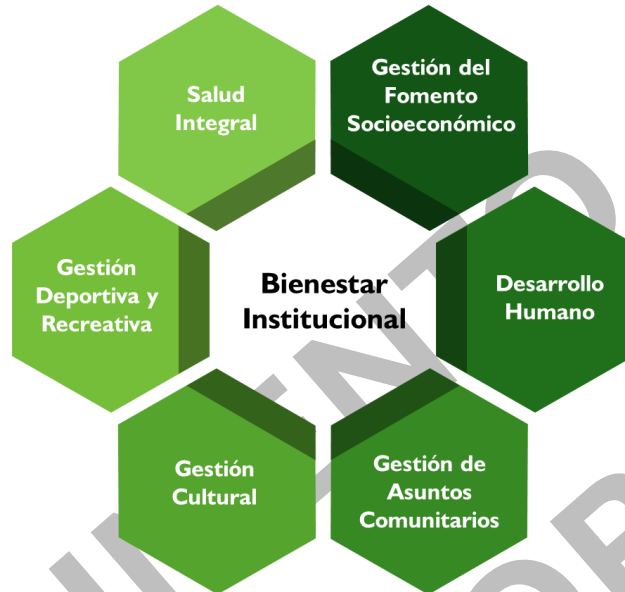
Ilustración 3. Subprocesos de Bienestar Institucional – UIS

Con el propósito de dinamizar la gestión del Bienestar Institucional y dar respuesta tanto a los retos planteados en esta propuesta como a los actuales de la UIS, se han estructurado nuevos subprocesos que permitirán ampliar el alcance y aumentar la efectividad en la implementación de programas y proyectos en esta área.