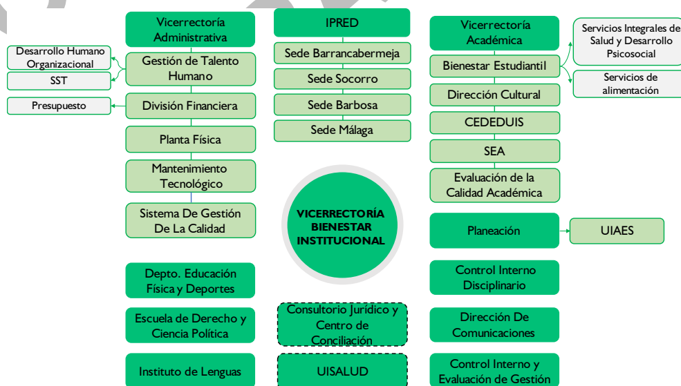
Ilustración I. Mapa de actores clave – Estructura organizacional

Para visualizar esta estructura de manera clara y organizada, la Ilustración I presenta el Mapa de actores clave de la estructura organizacional. Este diagrama detalla las dependencias, divisiones y unidades de la UIS que se identificaron en este diagnóstico y que, en la actualidad, están directamente involucradas en la implementación de iniciativas orientadas a la promoción de las políticas y dimensiones de bienestar de toda la comunidad universitaria.