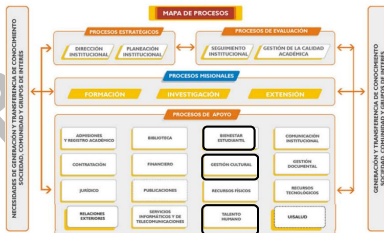
Ilustración I. Mapa de Procesos Actual –UIS

Las siguientes ilustraciones muestran el cambio en el mapa de procesos de la institución, donde se formaliza este nuevo proceso, el cual se articulará con otras dependencias para trabajar conjuntamente en los programas y proyectos que darán cumplimiento a todas las dimensiones de la Política de Bienestar Institucional.