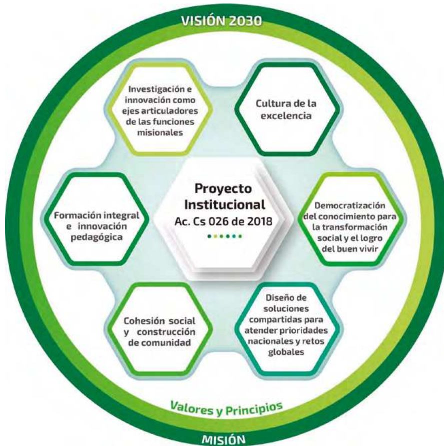
Figura 1. Estructura del Proyecto Institucional. Universidad Industrial de Santander - UIS (2018) Acuerdo del Consejo Superior N.º 26 de 2018.