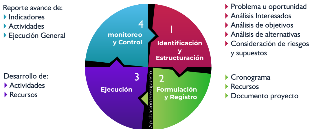
Fig 3. Ciclo del proyecto del Programa Anual de Gestión

Los proyectos de gestión en las UAA se desarrollan mediante cuadro etapas como se presenta a continuación: