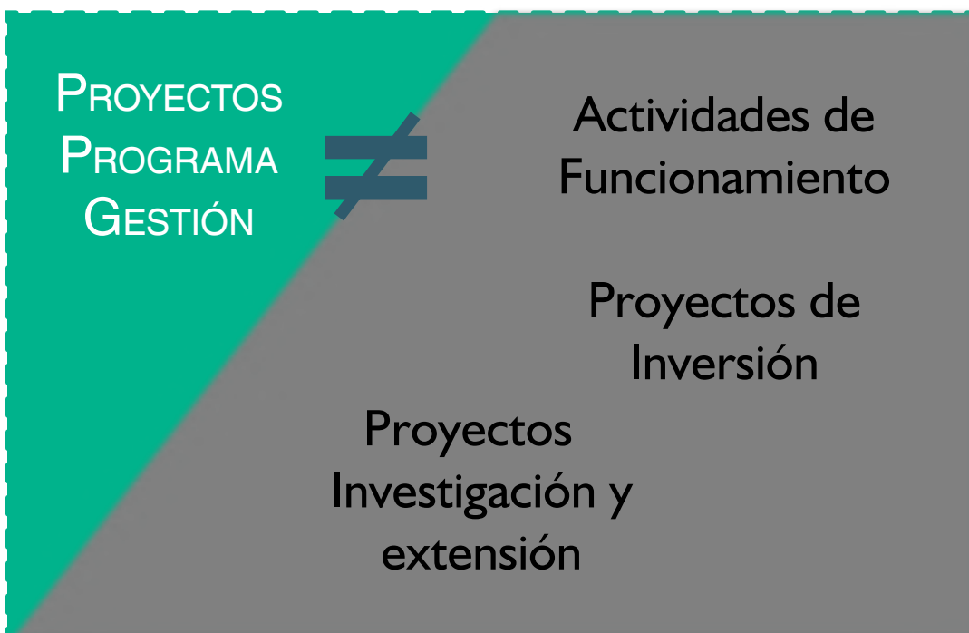
Figura 1: Modelos de gestión Unidad.