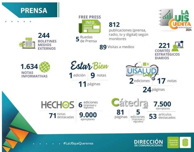
Figura 2. Cifras de prensa UIS 2024

Se pusieron en marcha campañas de gran impacto como: UIS 76 años, Acreditación Internacional ABET, Campaña Humanización Médica; Admisiones de pregrado presencial 'Imagina Ser UIS'; Admisiones IPRED; Concurso profesoral; Fiesta de las Luces; festivales como: Internacional de Piano, Música Andina Colombiana; Rasgatierra; Coral, Tuna, Bucarajazz, así como el registro de diferentes logros institucionales que dan cuenta de la gestión institucional y que se convierten en un aporte invaluable para la transformación regional y nacional.