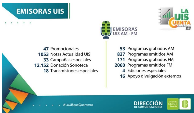
Figura 3. Cifras de emisoras UIS 2024