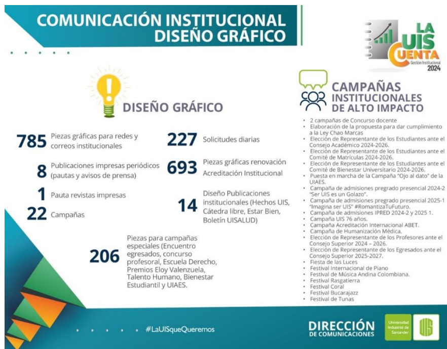
Figura 5. Cifras de diseño gráfico, comunicación institucional UIS 2024

Asimismo, se destaca la importancia de la página web institucional como medio para rendir cuentas de manera permanente a través las diferentes publicaciones permitiendo a los grupos consultar la información de su interés. A continuación, se presentan algunas cifras del tráfico que la página web tuvo durante la vigencia 2024: