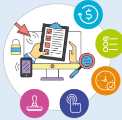
Racionalización Documental Sistema de Gestión de Calidad (2020 a 2024)